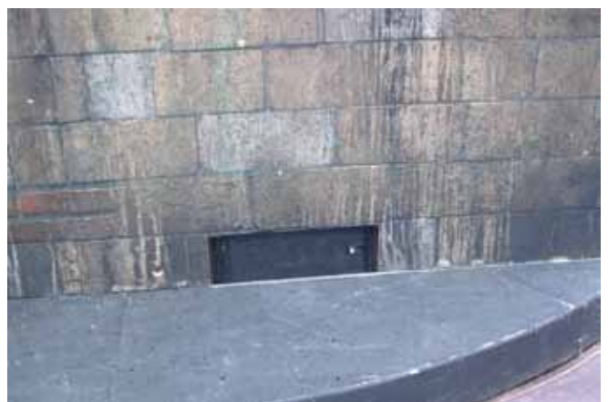
UPM 1P.