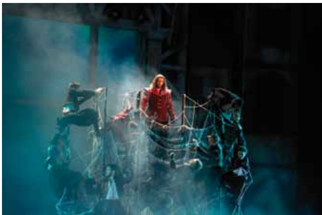
Фото Alfio Morelli